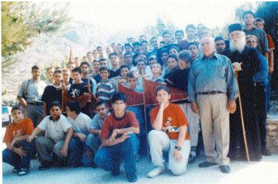
Κατασκηνωτές του Άγίου Στεφάνου Περαώρας-Λουτρακίου τό 2002.