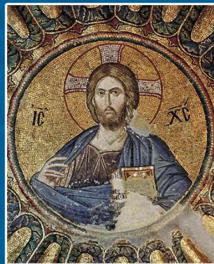
“ΙΩΑΝΝΗΣ Ο ΒΑΠΤΙΣΤΗΣ”

Κυκλοφορεῖ τὸ ἡμερολόγιο τοῦ Συλλόγου μας γιὰ τὸ ἔτος 2019. Ἀφιερωμένο στήν παρόντα Χρόνο , πού εἶναι ἡ εὐκαιρία γιὰ νά κερδίσουμε τὴν αἰώνια ζωή. Τιμᾶται 1 εὐρώ. Γιὰ περισσότερα (πάνω ἀπὸ 30) γίνεται ἔκπτωσης 30%. Τηλ.: 2103212713-2109765440.